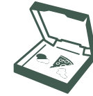
علب الطعام الورقية المتسخة

لا يمكن وضع هذه العناصر في أي صندوق قبامة يجمع من على الرصيف. خذها إلى مركز تدوير النفايات المحلي الخاص بك.