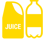
القناني والعلب البلاستيكية