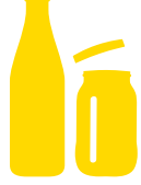
القناني والقوارير الزجاجية